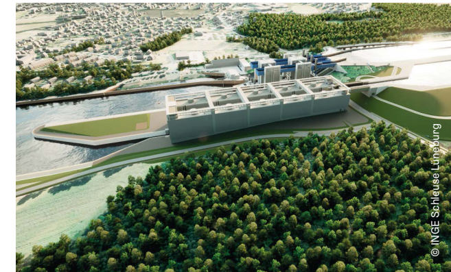
60 Meter westlich vom Schiffshebewerk entsteht die neue Schleuse Lüneburg.

Als weltweit höchste Sparschleuse wird die Schleuse Lüneburg einen Höhenunterschied von 38 Metern ausgleichen. Ihre Kammer wird 225 Meter lang und 12,5 Meter breit sein. Diese Dimensionen machen sie zu einem einzigartigen Bauwerk. Ein zum Projektteam gehörendes Architekturbüro sorgt dafür, dass sich das Bauwerk harmonisch in die Landschaft einfügt.