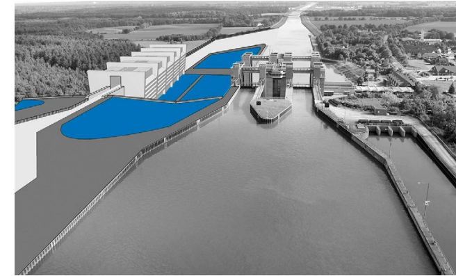
60 Meter westlich vom Schiffshebewerk entsteht die neue Schleuse Lüneburg.

Als weltweit höchste Sparschleuse wird die Schleuse Lüneburg einen Höhenunterschied von 38 Metern ausgleichen. Ihre Kammer wird werden 225 Meter lang und 12,5 Meter breit sein. Diese Dimensionen machen sie zu einem einzigartigen Bauwerk. Ein zum Projektteam gehörendes Architekturbüro sorgt dafür, dass sich das Bauwerk harmonisch in die Landschaft einfügt.